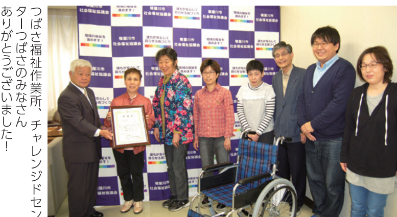
つばさ福祉作業所、チャレンジセンターつばさのみなさんありがとうございました!

<お願い>お受けできる物品は、新品(相当)のものに限ります。ご理解・ご協力のほどお願いいたします。