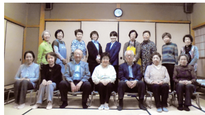
みんな笑顔で!いつも明るい雰囲気のはるこま会会員の皆さん

ひとり暮らし高齢者の会「木屋校区」はるこま会は、同じ立場の人たちが集まりみんなで楽しみながら、20年以上も活動を続けています。