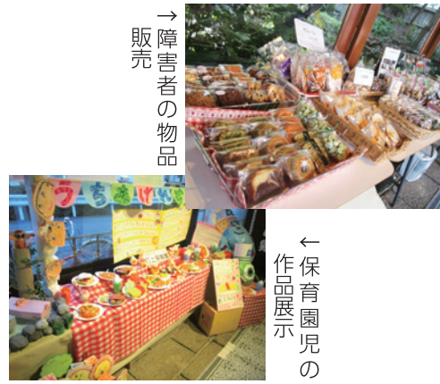
→障害者の物品販売

平成30年1月15日から3月23日までの期間限定で開催した地域貢献委員会の取り組み「チヨット寄ってん家」。3か月間に延べ来場者数は580人、協力スタッフ数は155人と大勢の方々の来場ならびに協力で終了しました。「このつながりを継続したい」との思いから今年度から改めて毎月初旬の3～5日間実施する運びとなりました。