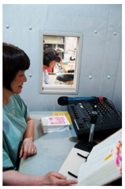
2人一組となり録音室で声を吹き込みます

Q. この活動をしていて良かったと思うときは? A. 図書館の本1冊分が1枚のCDに録音されて完成し、それを聞いた視覚障害者の方が喜んでくださった時や、さまざまな情報をカセットに録音したものを希望者に送付し、返却してもらった際に点字で書かれたお礼状を頂いた時は、とてもうれしいですね。