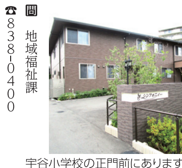
☎ 地域福祉課 0838-0400 宇谷小学校の正門前にあります

する場合があります。 ※この他にも市内で献血があります。 ☎ 北大阪赤十字血液センター 072163214747 (市外局番からおかけください)