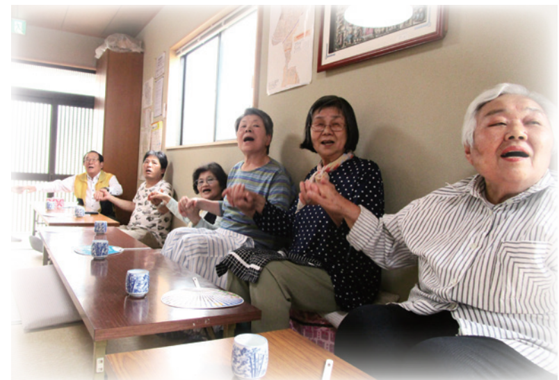
各地区でのいきいきサロンや福祉ふれあいまつり、小学生への福祉体験学習など、活発に活動しています。