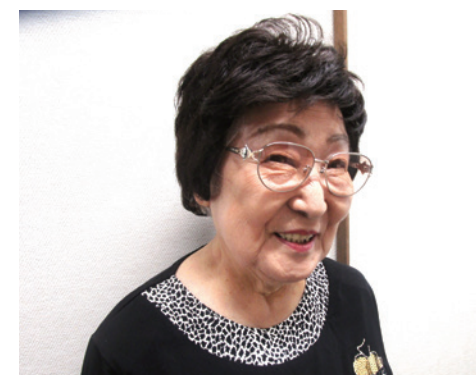
おもて 全員参加での会活動を進めている表会長

主な活動として、食事会や講習会の開催、にぎわいバザーへの参加(年一回)があり、活動を通して会員同士の声かけや見守りを行っています。その他、毎月2回開催している