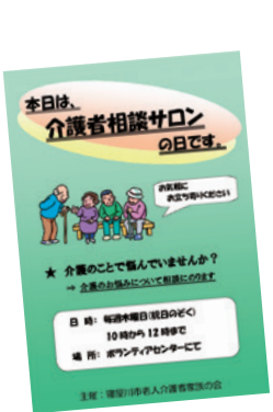
今日は、介護者相談サロンの日です。 * 介護のことでお悩んでいますか? → 企業のお話しに聞いてもらいます 日時: 毎月第2日曜日の10時～12時 場所: 福祉センターにて 主催: 宇谷校区福祉委員会

ボランティア活動紹介 朗読ボランティアにじの会 (昭和50年4月設立) ひと言ひと言 心を込めて Q. 朗読ボランティアとは? A. 視覚障害者の方に広報や図書館の本などを朗読し、CDやカセットテープに録音して情報提供する活動です。 Q. 会員数は何人ですか? A. 現在は33人で行っています。毎月の勉強会や日々の朗読・録音活動、更には完成したCDやカセットを送る作業など、全員で活動しています。 Q. これからの目標は? A. ボランティア活動者を増員し、より多くの視覚障害のある人たちへさまざまな情報をお届けできるようにしたいです。