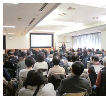
福祉委員と障害者団体協議会と一緒に災害対策について考えました