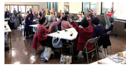
年に数回、八坂町公民館でも実施しています

中央校区福祉委員会ボランティア部会では、いきいきサロン「街カフェさくらんぼ」を地域の