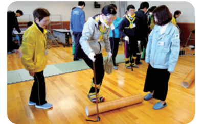
小・中学生だけでなく、市の新任職員研修でも高齢者疑似体験を実施

登録ボランティアグループ「うらしまさん」は、福祉体験学習を通して人に寄り添う心の大切さや、優しさへの気づきを育むお手伝いをしています。主に市内の小・中学校で、校区福祉委員会や保護者の方にご協力いただきながら、高齢者疑似体験やアイマスク体験、車イス体験などを教えています。「うらしまさん」では子どもたちの学びのために一緒に活動してくれる仲間を募集しています。まずは話を聞いてみたい!という方でも大歓迎です。ご連絡をお待ちしています♪