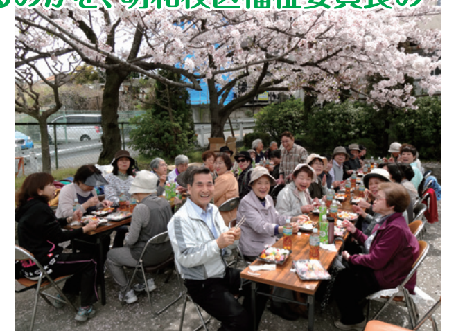
さくらのつどい(お花見会)も会費を活用して開催

A. 私は、この場を情報交換の場としても活用しており、住民に必要な情報を伝えるよう心がけています。また、参加者からも「見知った人と顔合わせできることを楽しみにし、今後もこの活動が継続して欲しい」という声をいただいています。