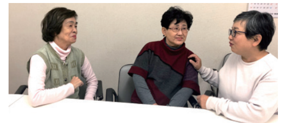
日頃から仲の良いスタッフさんたち

A. ボランティア活動では無理をせず、参加者からの声に喜びを感じながら楽しんでいます。