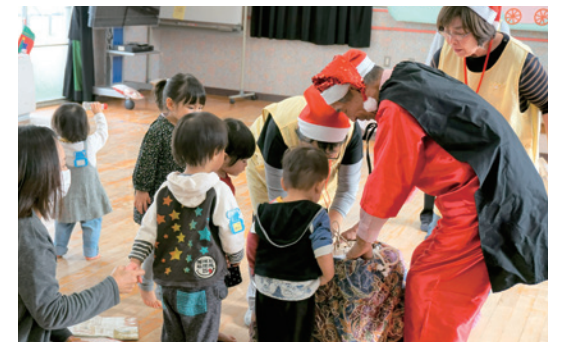
サンタからのプレゼントに、子どもたちも大喜び