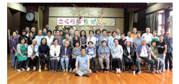
みんな笑顔で短冊に願いを込めて

A. 毎年会員になってもらうよう、行事参加者に財源の説明をしています。今後も活動が継続できるように、会員募集の広報を地道にしていきます。