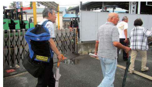
保管しているかぎを持ち出す訓練の様子