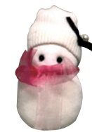
靴下ゆきだるまをみんなで作ってませんか?