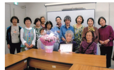
(寝屋川市母子寡婦福祉会)