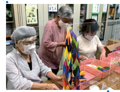
広島県の平和公園に届けるため千羽鶴を折りました(寝屋川市介護者の会)