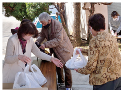
見守りかねて、所定の場所でお弁当を配りました(三井校区福祉委員会)

地域の子どもから高齢者・障害者に対して見守りや配食、交流会などの活動(約90%)