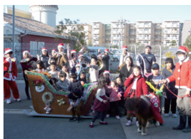
宇谷食堂(寝屋川苑)