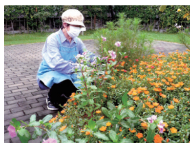
花の手入れで草花も元気に(園芸ボランティアらぶ)