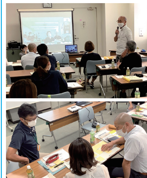
地域活動団体向け説明会の様子