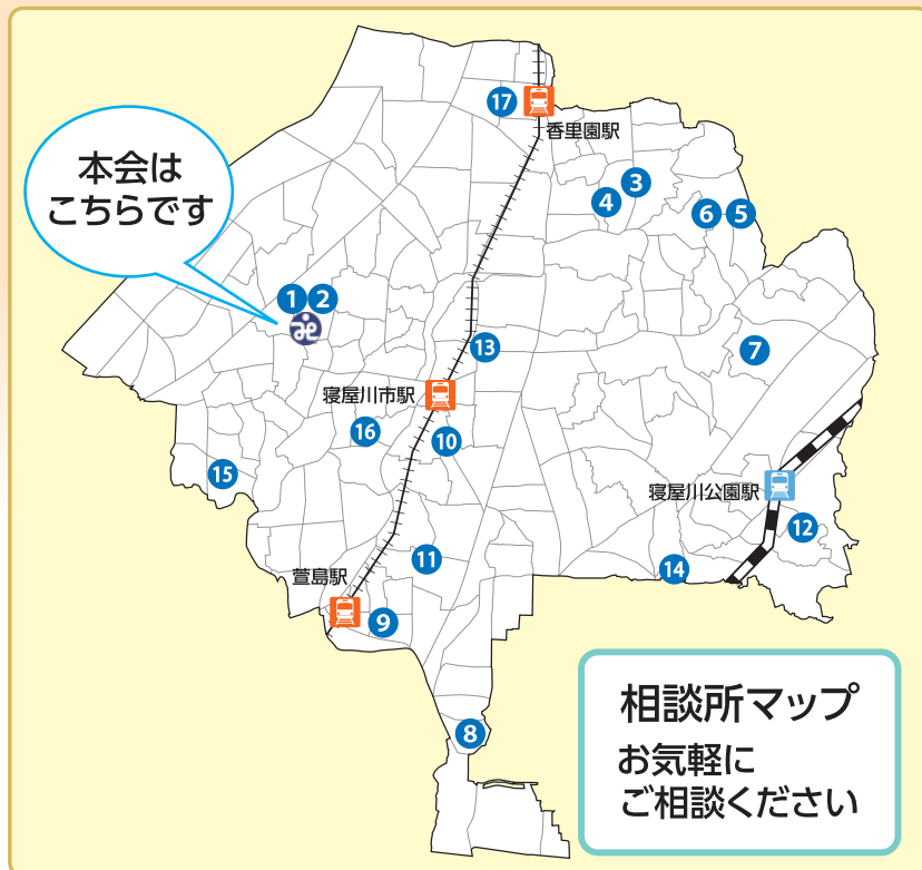
相談所マップ お気軽にご相談ください

令和2年度の生活相談件数は、新型コロナウイルスの影響もあり、延べ35,000件に上りました。