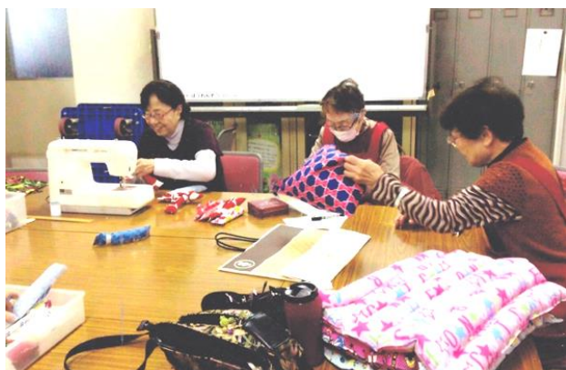
軽やかなミシンの音とともに、愛情もつまった小物が作り出されます＝ボランティアセンターで手作り小物は当センターでお求めいただけます