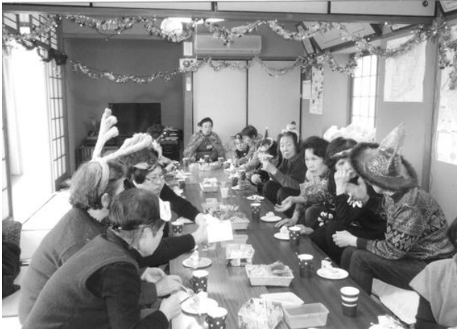
この日はクリスマス会。きれいに飾られた部屋でケーキとお茶を楽しみながら、お話しが弾みます。 あれ、トナカイの角も見えますよ＝地域の公民館で

主な活動は年10回の「ふれあいサロン」の実施と「ボランティアセンターからの依頼の活動」で、『無理なく』『明るく』『楽しく』をモットーに試行錯誤しながら、取り組んでいます。また、ひと時のやすらぎを感じてもらえるように心がけています。 参加者の声として「たわいない会話を楽しながらも悩みを聞いてもらうこともあり、人との触れ合いを感じ