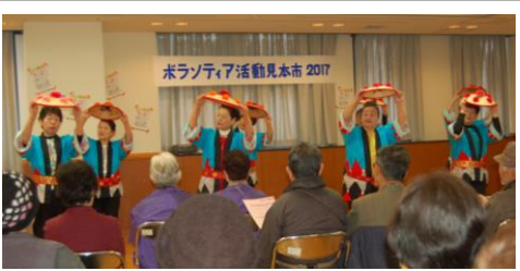
おそろいの衣装に花笠をかざしての踊り披露＝なでしこ会の皆さん

初出演グループも「楽しんでいただけたらうれしく、励みになる」と。その後、施設や校区などからの出演依頼が続いています。 企画から関わった担当者は「発表者と地域や施設双