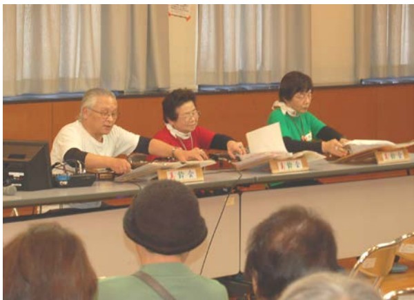
美しい大正琴の音色に会場の皆さんはうっとり・・・ 「ボランティア活動見本市会場」