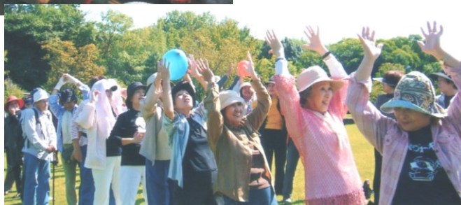
→風船贈りゲームで一汗かきました＝池田城跡公園

しみの一つです。 毎月第2木曜日の定例会は、役員7人が当番制で司会を務め、それぞれの持ち味で和やかな雰囲気の中、ボランティア依頼の調整会議等を行っています。 「活動は、決して無理をせずできる時にするのがボ