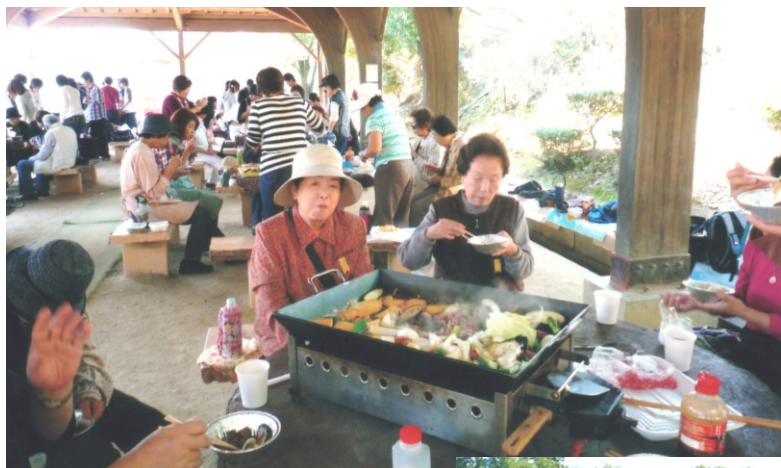
↑みんなでバーベキューを楽しみました＝男山レクリエーションセンター

木田校区ボランティア部会は30人の部員で活動しています。 20年来の年中行事として・手作りマドレーヌ持参で友愛訪問・福祉映画会・研修会・木田小学校の福祉体験学習の手伝い、また校区在住の65歳以上の皆さんとのミニハイキングは、植物の散策や、時には現地で手作りカレーやバーベキューで盛り上がり、参加者の方は久しぶりの再会も楽