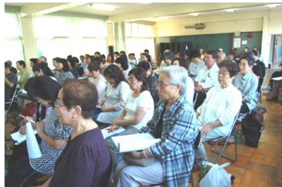
講師の話に聞き入る参加者