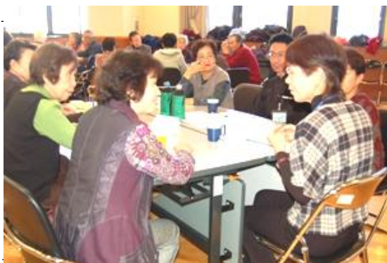
ボランティアの意義や感動を話し合う参加者 ⇒前回の「つどい」会場

今年10回目を迎える当つどいのテーマは「わたしのあなたのボランティアの自慢」。社協、市民活動センターの双方より2組ずつのボランティアが日ごろの活動を