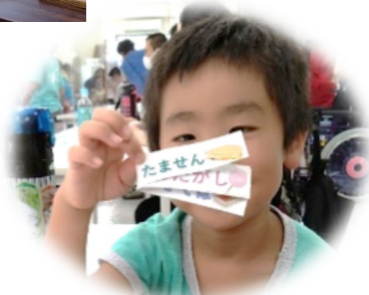
きれいに作られた食券

「さん・すまいる」の仲間の皆さんはチケット配りや店員さんになって、参加者との楽しい交流のひとつになりました。