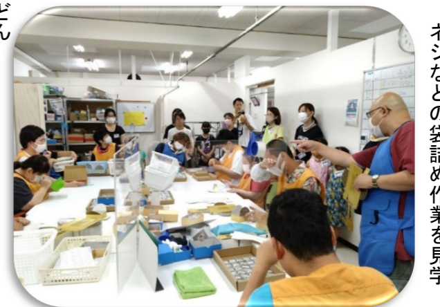
ネジなどの袋詰め作業を見学