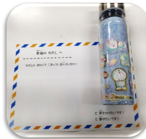
「〇年後のわたしへ」のメッセージを書き込んでカプセルに入れました