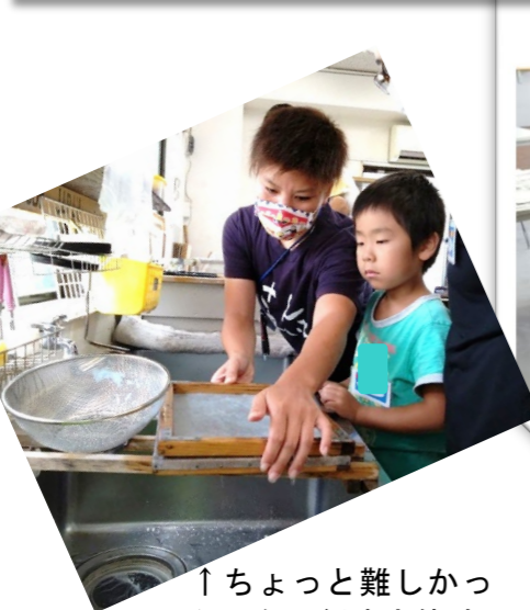
↑ちょっと難しかったかな？紙すき体験