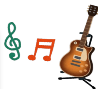
4人の奏者によるギター演奏はその音色が会場中に美しく響き、懐かしい曲は参加者の心に染みわたったようです