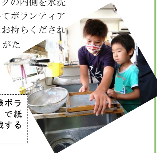
「夏の体験ボランティア」で紙すきに挑戦する小学生

牛乳パックの内側を水洗い後、開いてボランティアセンターにお持ちくだされば大変ありがたいです。