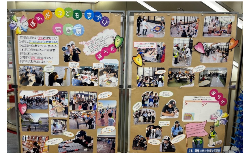
元気で楽しそうな写真が展示され、立ち止まって観ている人や評価のシールを貼る人の姿も

キッズキャスト(小・中学生ボランティア)や大学生ボランティアが主となって、地域のボランティア、さまざまな企業・団体とつくりあげた初めてのまつり【ぼら子どもまつり】を振り返るとともに、「市民の皆さんにボランティア活動の魅力を写真で伝えたい」という実行委員の思いで実現しました。