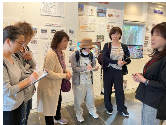
コリアタウンの歴史資料館で実践活動

私達は座学や実習を通じて楽しく活動しております。勉強会の見学や、お問い合わせなど興味がありましたら、ご連絡ください。お待ちしております。