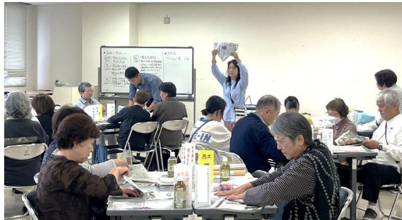
新聞紙やビニール袋を使って簡易トイレ作りの説明を受けながら、挑戦する参加者

習会を開きたいと思 ○乾パン軽食=賞味期限ギリギリの乾パンを利用して、おやつや軽食になるのは「食べ物を大切に」の観点からも有意義だと思いました。 ○日頃の生活が一変するような災害時に、数ある持ち出し品リストの必要性を感じています。これを機会にチェックリストの作成を試みます。